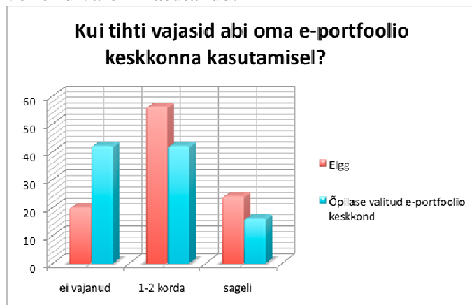
Joonis 1. Kui tihti vajasid abi oma e-portfolio keskkonna kasutamisel?

nendest 14st, kes töötasid enda valitud e-portfolio keskkonnaga. Seega Elgg'iga vajas abi 80% ja teiste keskkondadega 57% õpilastest. Kui Elgg'i kasutaja sai 1–2 korda abi, siis edasi tasakaalustus abivajamise protsent ning sarnanes enda valitud keskkonna kasutajate protsendiga. Tõenäoliselt on põhjuseks asjaolu, et need, kes said ise endale e-portfolio jaoks õpikeskkonna valida, jätkasid selle veebipõhise keskkonnaga, mida nad juba tundsid või olid varem kasutanud.