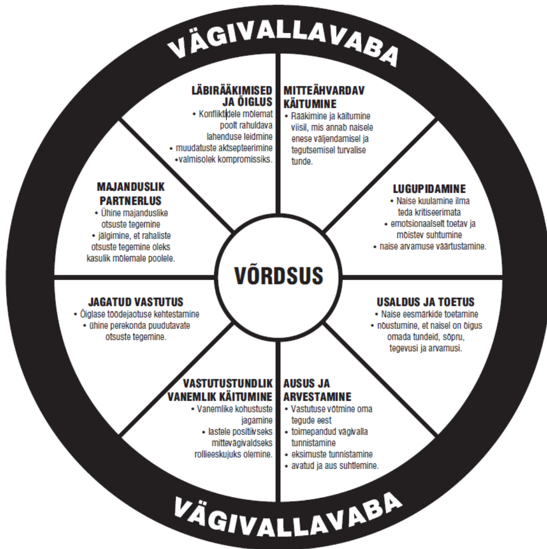
Joonis 3. Võrdsuse ratas (Allikas: Pence ja Paymar, 1993)